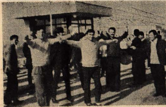
Çelik - Halat işçileri halay çekiyor!

Bu da göstermektedir ki, işbirlikçi patronların en fazla korktukları şey işçilerin birliği ve dayanışmasıdır.