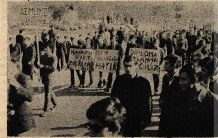
Sanat Okullu gençler, eğitim düzenini protesto yürüyüşünde.

Teknik okullardaki bozuk eğitim uygulaması, hemen hepsi işçi - köylü - esnaf - öğretmen çocuklarına yük. sek öğrenim kapılarının kapatılması, lise mezunlarının direniş hareketleri, sanat okullarının boykot hareketleriyle patlak verdi. 50 den fazla sanat okulu'nun binlerce öğrencisi, velilerinin de desteğini alarak bozuk eğitim düzenine başkaldırdı, açık oturum, konferans, yürüyüş ve diğer demokratik direniş hareketleri ile seslerini Türkiye halklarına duyurdu.