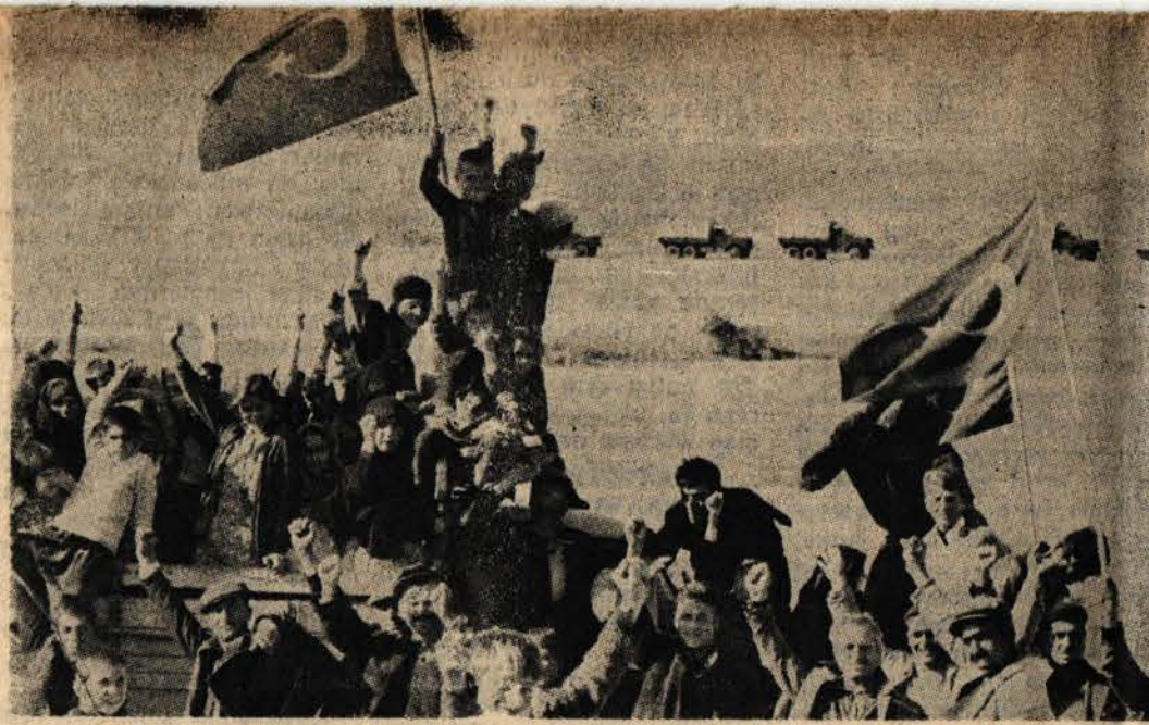
Değirmenköylülerin mücadele bayrağı kesin zafere kadar dalgalanacaktır!

İlk başlarda, köyün nüfusu az olduğundan toprakların tamamı işlenmiyor. Sonraları, Yılmaz ağalar, Değirmenköy muhtarlarını parayla satın alarak, köylünün satmış olduğu toprağın 5 bin dönümü (Devamı 2 nci sayfada)