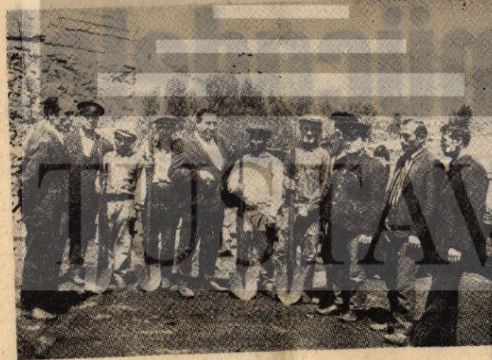
Alpagut İşçileri haklarını alacaktır!

kovduğu yabancı artık hiç unutamayacağı bir şamar yesin, yerli işbirlikçi kökü dışardaki dayanağını kaybet-sin, ara yerde dolaşsın «dü-günde zurnaya, hamamda kurnaya aşık, olanlar gibi Ortak Pazar'ı Avrupalılaştırmak sananlar da serkeş öküzün, soluğu ergeç kasap dükkanın da alacağını görsün.